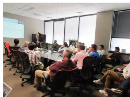
NGKオートモーティブセラミックスUSAで開催されたコンプライアンスセミナー

また、海外グループ会社に対しては前年度と同様に競争法、贈収賄防止規制にコンプライアンス一般を加えたセミナーを実施しました。