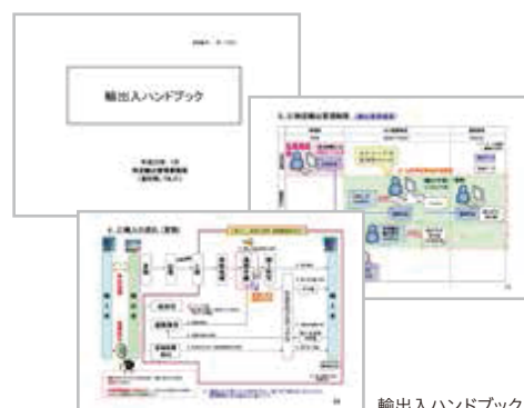
輸出入ハンドブック

輸出入管理関連の勉強会は、担当部門の実務者に対し年1回以上行っており、2017年度は合計23回行い、496名が参加しました。