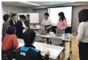
韓国文化交流会(2017年10月)