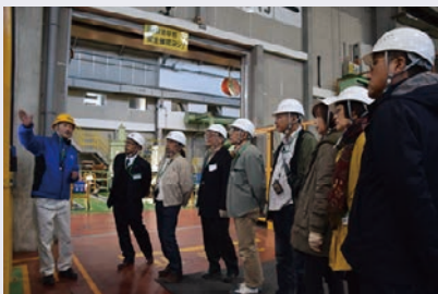
ベリリウム銅の製造工程について説明を聞く参加者

地域住民に日本ガイシのものづくりや事業活動について理解を深めてもらうよい機会となりました。