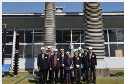
世界最大級のがい管前で記念撮影