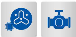
半導体製造装置用セラミックス