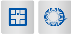
電子・電気機器用セラミックス