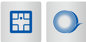
電子・電気機器用セラミックス