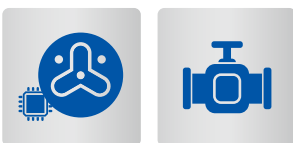
半導体製造装置用セラミックス