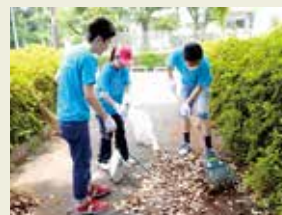
地域清掃 Local cleaning