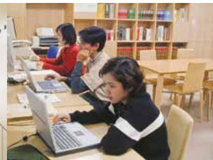
スタディールーム Study Room