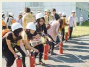
防災訓練 Fire drill

Crime and disaster prevention seminars are held for international students to spend safe and comfortable student lives. In addition, various events such as welcome and farewell party are also executed at times to deepen exchanges among the students and NGK employees. International students actively participate in various community events, and moreover, the students hold cross-cultural exchange meetings with the people in the community to contribute to internationalization of the community.