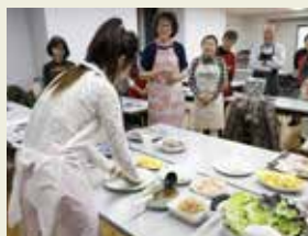
異文化交流会 Cross-cultural exchange meeting