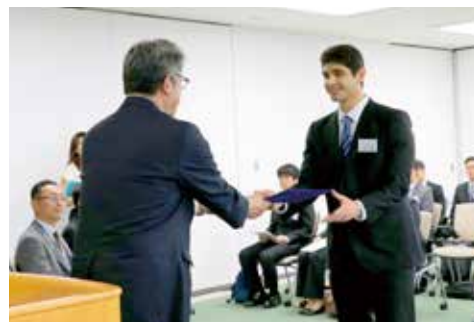
日本ガイシスカラシップ認定証授与式 NGK Scholarship Award Ceremony.

The NGK Foundation for International Students offers scholarships to international students pursuing their studies at college or university established in Aichi Prefecture at their own expense.