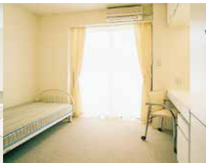
個室(18㎡) Private Room