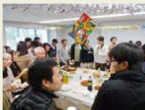
送別会 & 新年会 Farewell party & New year's party