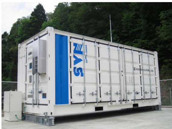
恵那市内に設置された恵那電力のNAS電池

事業の実施に要した費用の総計に対する、その事業の実施によって社会的に得られる効果(便益)の比率。通常、1以上であれば投資に見合う効果が得られると見なされる。