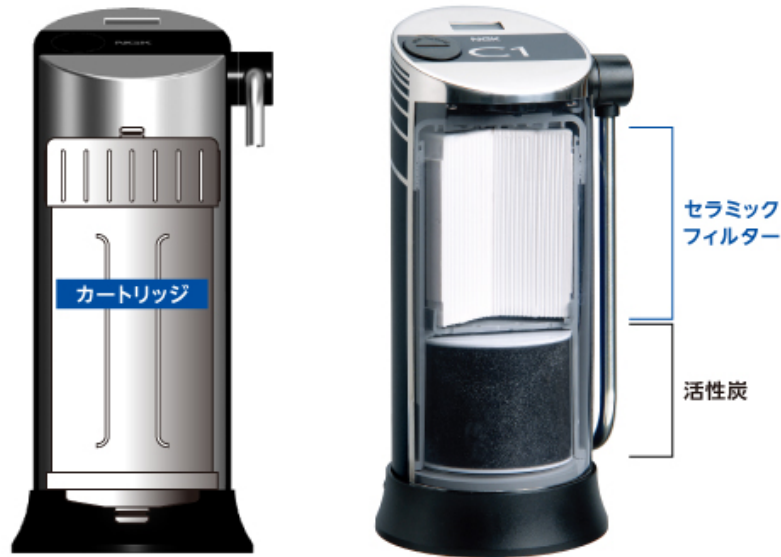
セラミックフィルター (拡大図)

C1のカートリッジの内部(開けられません)は、『セラミックフィルター(上層)』と『活性炭(下層)』の2層構造になっています。